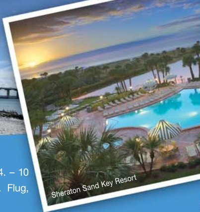
Sheraton Sand Key Resort