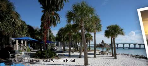
Privatstrand vom Best Western Hotel